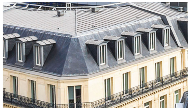
Toitures "à la Mansart"