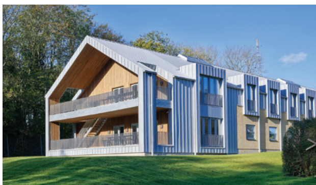
Arkitekter Blaavand og Hansson A/S

Sa résistance à la corrosion lui confère une longévité de 80 à plus de 100 ans. Sa souplesse, sa facilité de façonnage ou de pliage ou encore sa malléabilité permettent à la créativité des architectes des perspectives sans limites. Le zinc offre aussi des possibilités difficilement réalisables avec d'autres matériaux. Ces extraordinaires qualités en font le meilleur allié de vos réalisations.